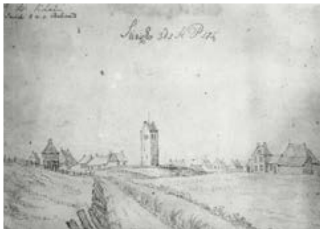
Links: De kerk van Driezum nog met een zadeldaktoeren op een tekening fan J. Gardenier-Visscher, 18e ieu. Rechts: De zadeldaktoeren van Zurich op een tekening uit de 18e eeuw.

Des nachts van den 5 en 6 dezer [febr. 1842] is de hooge stompe Boxumer Toren met een verbazende slag ingestort. 6