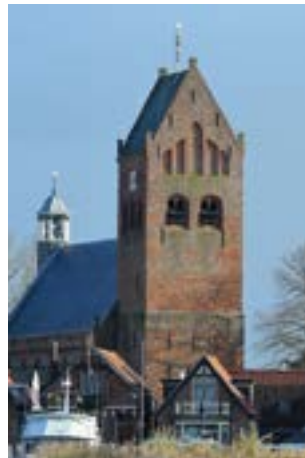
Links: De Sint Piter van Grou.

Eigenlijk is het, zoals al veel vaker is opgemerkt, een misverstand dat kerken met een zadeldaktoren specifiek bij Friesland horen. In Nederland zijn ze ook buiten Friesland te vinden, vooral in de provincie Groningen, maar ook op andere plaatsen, zoals in Anloo, Norg en Vledder (Drenthe), Losser (Twente), Geesteren (Achterhoek) en Vorchten (Veluwe). In het buitenland komen ze ook voor, veelvuldig zelfs, zoals in