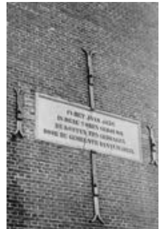
Rechts: Gevelsteen in de toren van Driezum.

Denemarken en Normandië en niet te vergeten in Oostfriesland - het bekendst is daar de scheven toren van Suurhusen - en op het Noordfriesse eiland Föhr.