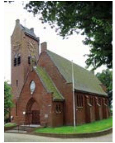
Links: Twee keer de kerk van Koarnwert: foto van de kerk met de stompe toren uit 1890 en van de kerk nu, met de hoge spitse toren. Rechts: De Sint-Fredericuskerk van Sloten.

komt tot uitdrukking in het gedicht “De idee fan Koarnwert”, dat hij nog op zijn oude dag uit zijn pen heeft laten vloeien (1951). Hij zegt het daar zo: 15