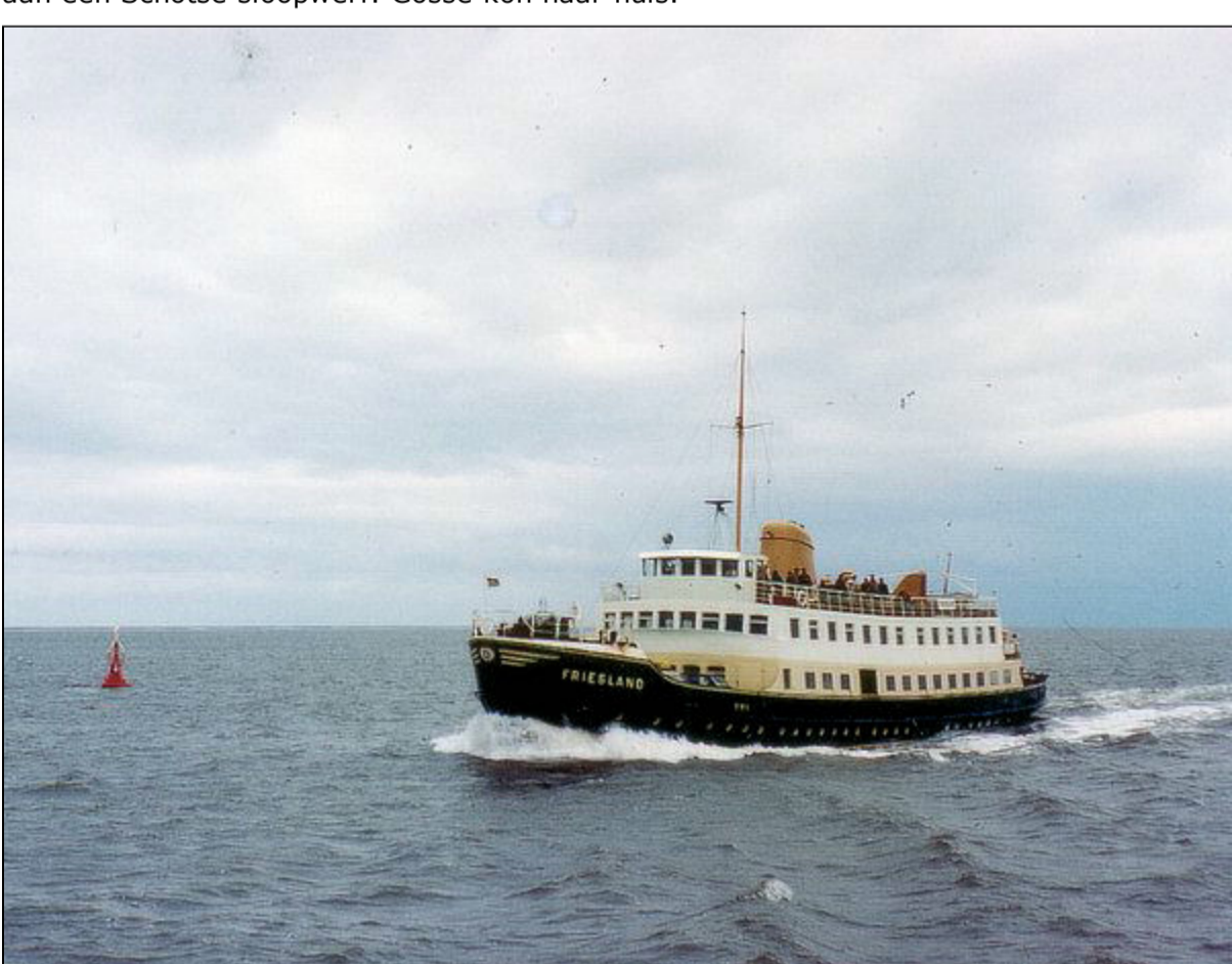
De FRIESLAND op weg naar Terschelling.